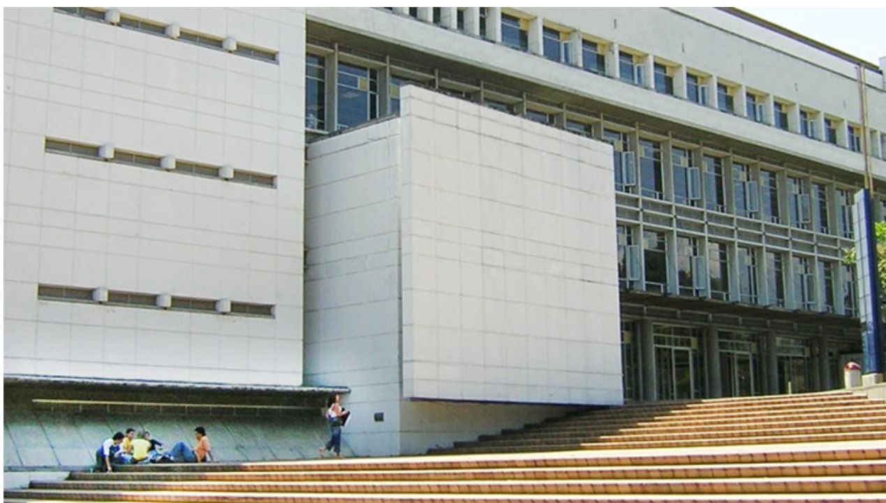
Estudiantes se relajan afuera de la biblioteca de la Universidad Pontificia Bolivariana en Medellín, que forma parte del Consortio Colombia

En este contexto, no se debe subestimar el poder de negociación de los consorcios de bibliotecas. Por ejemplo, incluso sin un acuerdo transformador, el consorcio de bibliotecas universitarias en Colombia ( Consortio Colombia ) pudo negociar una reducción en los precios de sus suscripciones con varias editoriales y obtener al mismo tiempo mayor acceso a títulos en todo el país. La experiencia extraída a raíz de estas negociaciones puede transferirse a discusiones sobre acuerdos transformadores, un modelo para convertir los costos de suscripción en acuerdos de publicación y lectura promovido y compartido en todo el mundo por OA2020 , con el que cOAlition S también está alineado.